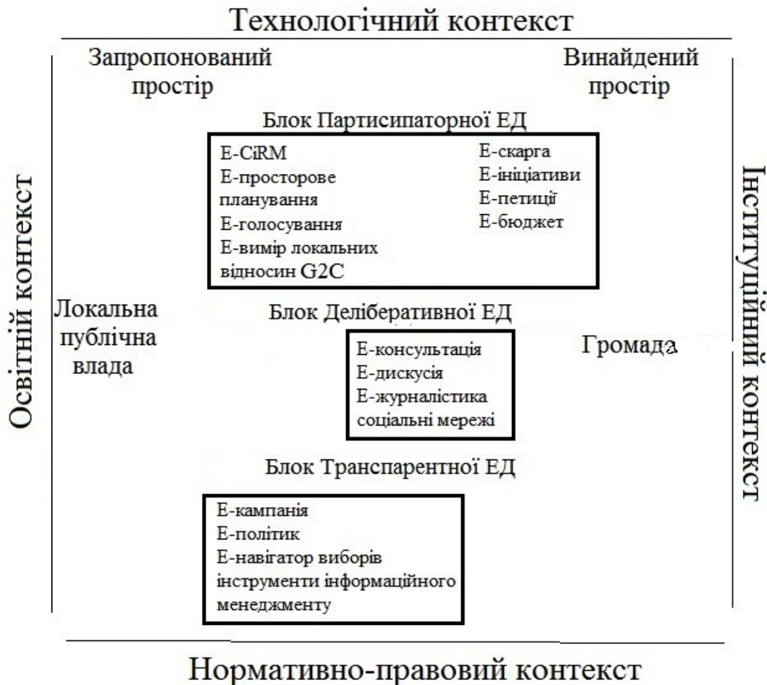
Рис. 3. Концептуальна модель електронної демократії як інструменту регіонального публічного управління. Джерело: [11, р. 320; 12, р. 10; 13].

Висновок. Підсумовуючи, зазначимо, що важливість диджиталізації локальної демократії як чиннику розвитку регіонів сьогодні не викликає сумнівів; такі її наслідки, як створення нових ефективних каналів комунікації між владою та громадою, розширення партисипаторних можливостей громади завдяки електронним інструментам, підвищення прозорості та інклюзивності регіонального менеджменту, роблять