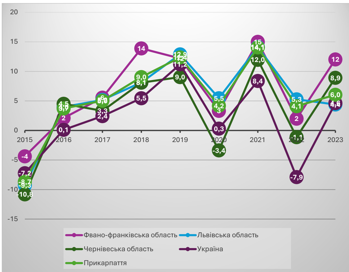
Рис. 3. Темп приросту частки зайнятих в сфері інтелектуальних послуг (%)