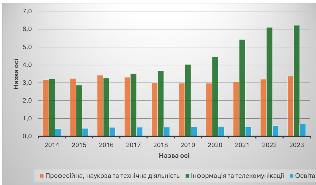
Рис. 2. Частка зайнятих в сфері інтелектуальних послуг та її складових Прикарпаття в загальній кількості зайнятих в регіоні (%)

так і повоєнного відновлення надзвичайно важливим стає динамізм переходу інноваційних рішень з рівня фундаментальної академічної науки і культури загалом на прикладний рівень» [6].