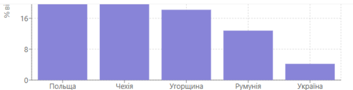
Рис. 2а. Співвідношення капіталізації фондового ринку до ВВП у країнах регіону, 2023 р.

Україні (4,2%) значно поступається показникам інших країн регіону, таких як Польща (28,4%), Чехія (21,6%), Угорщина (18,2%) та Румунія (12,8%). Це свідчить про недостатній розвиток ринку акцій та його обмежену роль у фінансуванні економіки. Рис. 2б демонструє стійку тенденцію до скорочення кількості публічних акціонерних товариств в Україні. За період 2019-2023 рр. їх кількість зменшилась з 1542 до 845 компаній, що відображає процес делістингу та зниження привабливості публічного статусу для українських компаній. Така динаміка негативно впливає на ліквідність ринку та можливості для диверсифікації інвестиційних портфелів.